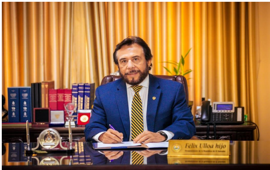
Sr. Félix Ulloa h.

Vicepresidente de la República de El Salvador