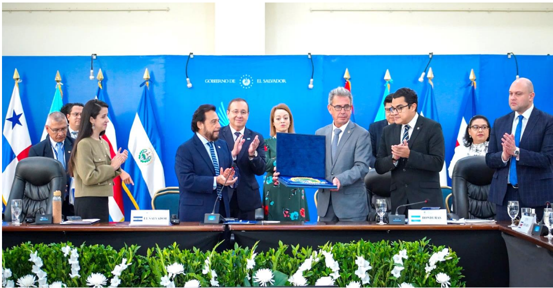
Traspaso de la Presidencia Pro T mpore de El Salvador a Honduras.

prioritarios relacionados a los ejes económico, social, medioambiental, seguridad de la región, así como el fortalecimiento institucional del Sistema.