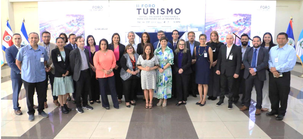
Ministra de Turismo y Presidenta Pro T mpore del Consejo Centroamericano de Turismo, Sra. Morena Valdez, y representantes ante el Organismo regional.

El Gobierno de El Salvador en lo que se refiere al sector tur stico ha implementado un proyecto insignia contenido dentro del Plan Cuscatl n Nueva Gobernanza, El Salvador 2019, la “Franja del Pac fico”, dentro del cual se encuentra el proyecto denominado “Surf City”. Este consiste en un circuito de playas de primer nivel, que abarca todo el territorio, de occidente a oriente, dotando de infraestructura de acceso y servicios b sicos a los principales sitios tur sticos de playa del pa s.